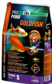
JBL PRO POND GOLDFISH S Futtersticks für kleine Goldfische