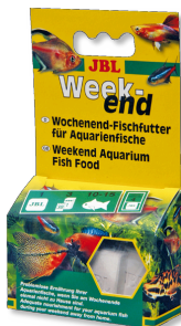
JBL Weekend Wochenend-Alleinfutter für alle Aquarienfische