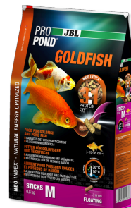
JBL PRO POND GOLDFISH M Futtersticks für mittlere bis große Goldfische