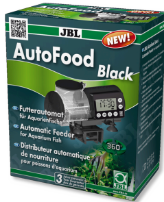
JBL AutoFood BLACK Akvaryum balıkları için siyah yem otomati