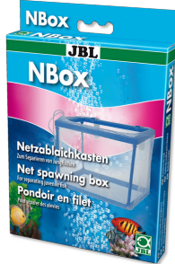
JBL NBox Akvaryum balıkları için tül yavruluk