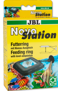
JBL NovoStation Su seviyesi dengeleyici ile birlikte yüzer yem halkası