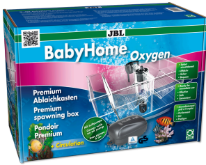
JBL BabyHome Oksijen Premium yavruluk, hava pompası ile birlikte komple set