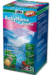
JBL BabyHome pro Air Pisolit montajı için yavruluk