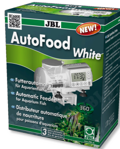
JBL AutoFood WHITE Akvaryum balıkları için beyaz yem otomati