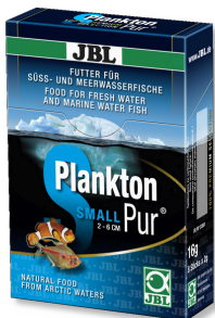
JBL PlanktonPur SMALL Leckerbissen für kleine Aquarienfische