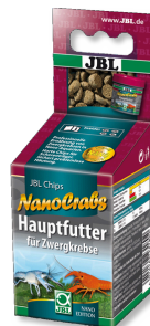
JBL NanoCrabs Alimento básico para acociles