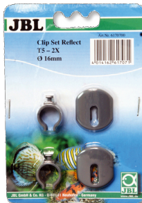
JBL SOLAR REFLECT Clip Set Halterung für Leuchtstoffröhren