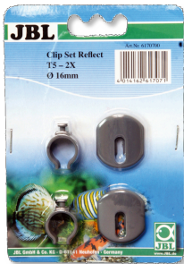
JBL SOLAR REFLECT Clip Set Halterung für Leuchtstoffröhren