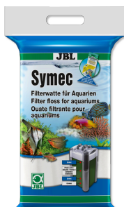
JBL Symec Algodón filtrante p. eliminar cualquier enturbiamiento