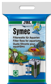
JBL Symec Algodão filtrante Algodão filtrante contra todas as turvações da água