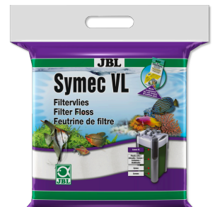
JBL Symec VL Velo de algodão p/ filtros de aquário contra turvações