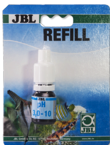
JBL pH 3,0-10,0 тест Экспресс-тест для определения значения pH