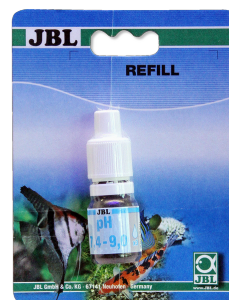
JBL pH 7,4-9,0 тест Тест pH в диапазоне 7,4-9,0 для аквариумов и прудов