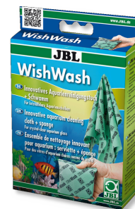
JBL WishWash Чистящая салфетка и губка