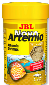
JBL NovoArtemio Piensos complementario de artemia para todos los peces