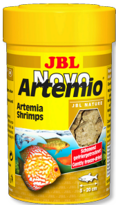
JBL NovoArtemio Tüm akvaryum balıkları için tamamlayıcı artemia yem