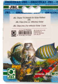
JBL Clips T5/T8 (Métal) Fixation en métal pour tubes fluorescents