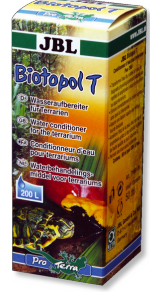
JBL Biotopol T Teraryumlar için su hazırlayıcı