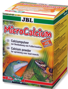
JBL MicroCalcium Tüm sürüngenler için minerali tamamlayıcı yem