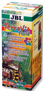
JBL TerraVit fluid Teraryum hayvanları için vitaminler ve eser elementler