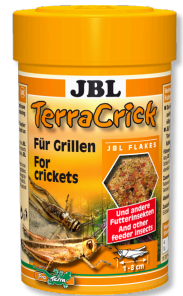
JBL TerraCrick Yemlik böcekler için tam yem