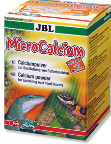
JBL MicroCalcium Tüm sürüngenler için minerali tamamlayıcı yem