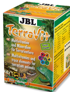
JBL TerraVit Powder Teraryum hayvanları için vitaminler ve eser elementler