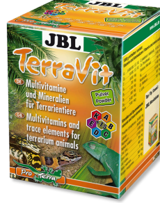
JBL TerraVit Powder Teraryum hayvanları için vitaminler ve eser elementler