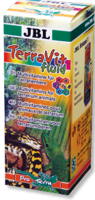
JBL TerraVit fluid Teraryum hayvanları için vitaminler ve eser elementler