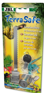
JBL TerraSafe Serratura per il vetro del terrario