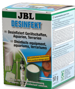
JBL Desinfekt Disinfettante per acquari