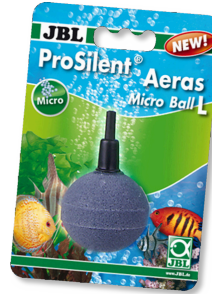
JBL ProSilent Aeras Micro Ball L Piedra difusora para burbujas de aire finas