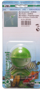
JBL Floater with AntiKink Flotador con protector antidobleces para PondOxi Set