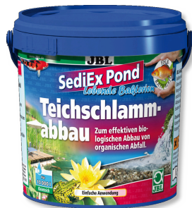
JBL SediEx Pond Bacterias y oxígeno activo para degradar el lodo