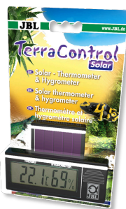
JBL TerraControl Solar Thermomètre/hygromètre solaire pour tous terrariums