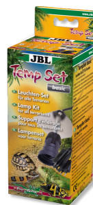
JBL TempSet basic Kit d'installation pour spot de terrarium