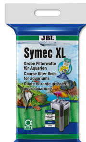
JBL Symec XL Grobe Aquarien-Filterwatte gegen alle Wassertrübungen