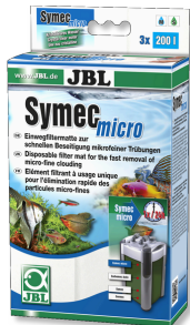
JBL Symec micro Akv. filt. için su bulanıklıklarına karşı mikro keçe