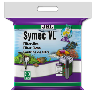
JBL Symec VL Her türlü su bulanıkl. karşı akv. filt.-pamuğu keçesi