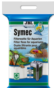
JBL Symec Tüm su bulanıklıklarına karşı filtre pamuğu