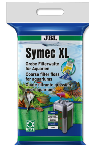
JBL Symec XL Filtre yünü Her türlü su bulanıklığına karşı kaba akv. filt. pam.