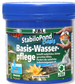
JBL StabliPond Basis Grundpflegemittel für alle Gartenteiche