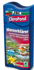
JBL CleroPond Wasserklärer zur Beseitigung von Wassertrübungen