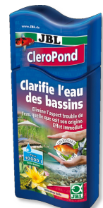
JBL CleroPond Conditionneur d'eau pour l'élimination de la turbidité