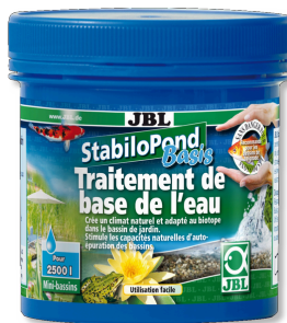
JBL StabliPond Basis Produit d'entretien de base pour bassins