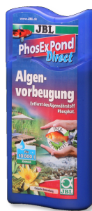
JBL PhosEx Pond Direct Eliminador de fosfatos para el estanque