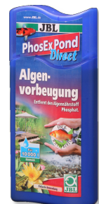
JBL PhosEx Pond Direct Eliminador de fosfatos para el estanque