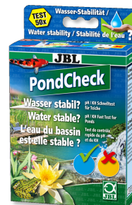
JBL PondCheck Test rápido para determinar el valor del pH y de la KH