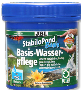
JBL StabiloPond Basis Producto para el cuidado básico de todos los estanques