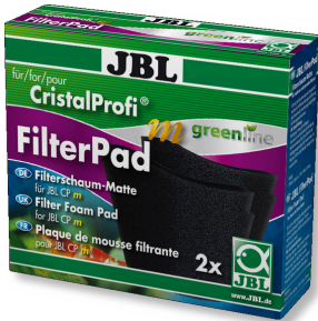
JBL CristalProfi m gl FilterPad CristalProfi m iç filtresi için yedek sünger