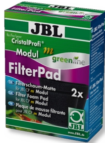
JBL CristalProfi m gl FilterPad modülü CristalProfi m modülü için yedek filtre keçesi