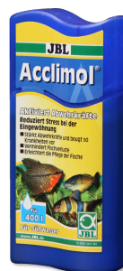
JBL Acclimol Preparazione dell'acqua per un nuovo ambientamento