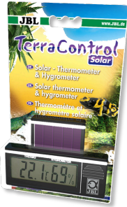
JBL TerraControl Solar Solar-Thermometer und Hygrometer für alle Terrarien