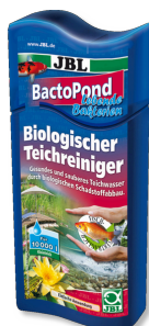
JBL BactoPond Bacterias para la autolimpieza del estanque