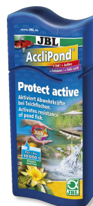
JBL AccliPond Acondicionador para el agua del estanque