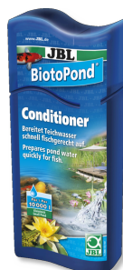
JBL BiotoPond Acondicionador para el agua del estanque