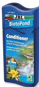
JBL BiotoPond Acondicionador para el agua del estanque