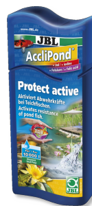
JBL AccliPond Acondicionador para el agua del estanque