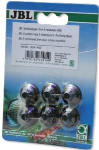
JBL Schlitzsauger 2 mm Halterung für Heizkabel für Aquarien und Terrarien