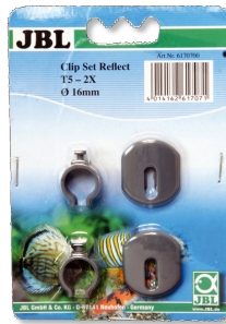
JBL SOLAR REFLECT Set clips Soporte para tubos fluorescentes