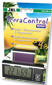
JBL TerraControl Solar Termómetro solar e higrómetro para todos los terrarios