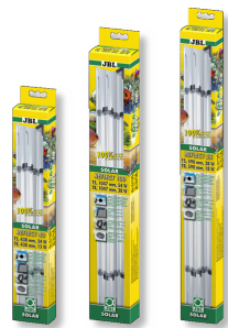
JBL SOLAR Reflect T5/ T8 - 895-1500 mm Lámina reflectora para tubo fluorescente solar