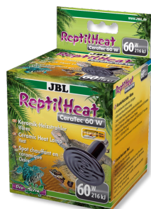
JBL ReptilHeat Lámpara calefactora de cerámica