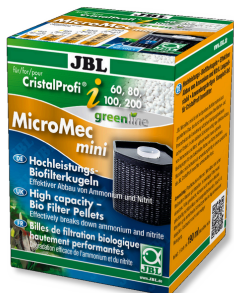
JBL MicroMec CristalProfi i60/80/100/200 Bolas filtrantes de alto rendimiento p. CristalProfi i