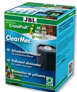
JBL ClearMec CristalProfi i60/80/100/200 Eliminador de nitritos, nitratos y fosfatos para CPI