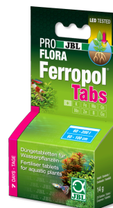
JBL PROFLORA Ferropol Tabs

Fertiliz. diario para plantas de acuario de agua dulce