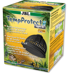
JBL TempProtect II light Protector contra quemaduras reptiles para JBL TempSet