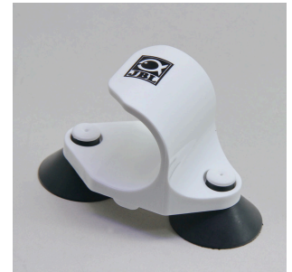
JBL PF Direct Halterung komplett