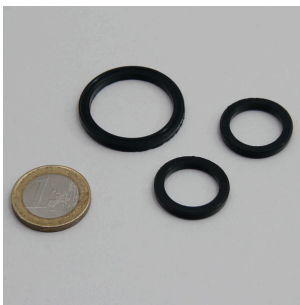
JBL PF Direct Dichtungsset