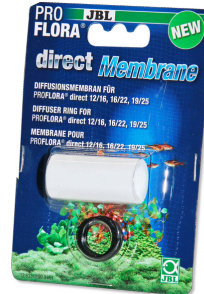
JBL PROFLORA Direct Membrane 12/16,16/22,19/25 Austauschmembran für ProFlora Direct