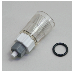
JBL PF Direct Blasenähler