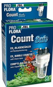
JBL PROFLORA CO2 Count Safe Blasenähler mit Rücklaufsicherung