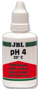
JBL Solution tampon pH 4,0 Solution d'étalonnage à pH 4,0 pour électrodes à pH