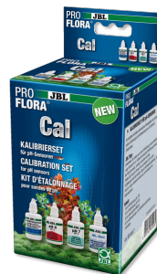
JBL PROFLORA Cal Kit complet d'étalonnage