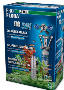
JBL PROFLORA m501 Système complet de fertilisation au CO2 des plantes aquatiques