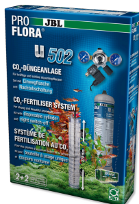
JBL PROFLORA u502 Système de fertilisation avec coupure nocturne