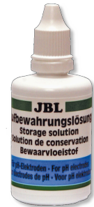
JBL Solution de conservation Solution de nettoyage et de conservation d'électrode