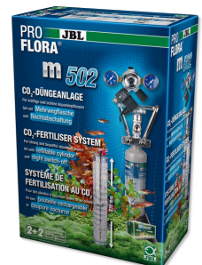
JBL PROFLORA m502 Fertilisation au CO2 des plantes aquatiques avec coupure nocturne