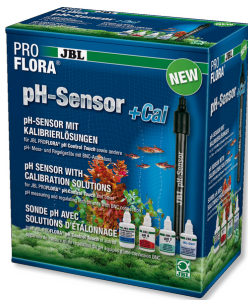
JBL PROFLORA Sonde pH+Cal Électrode de pH avec connexion BNC