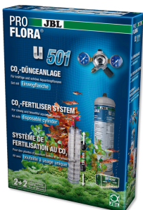
JBL PROFLORA u501 Komplettsset- Pflanzendüngenanlage