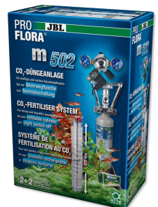
JBL PROFLORA m502 Fertilisation au CO2 des plantes aquatiques avec coupure nocturne