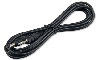
JBL pH-Control Touch Câble de raccordement