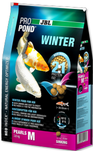
JBL PROPOND WINTER M