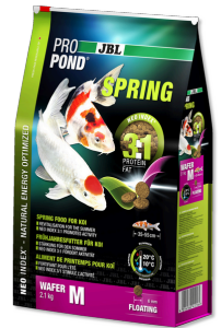
JBL PROPOND SPRING M

Küçük boy koi balıkları için ilkbahar yemi