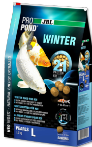
JBL PROPOND WINTER L