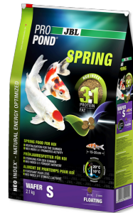
JBL PROPOND SPRING S

Küçük boy koi balıkları için ilkbahar yemi