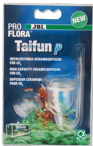
JBL PROFLORA Taifun P Mini-CO2-Diffusor für Nano- Süßwasser-Aquarien