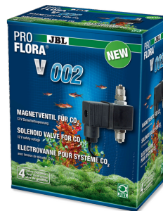
JBL PROFLORA v002 Válvula electromagnética silenciosa