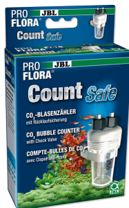
JBL PROFLORA CO2 Count Safe Contador de burbujas con válvula de retención