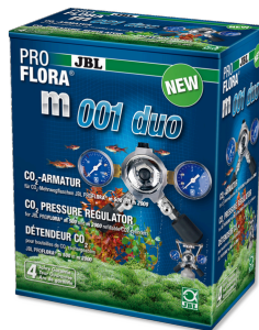
JBL PROFLORA m001 duo Válvula para regular presión, para 2 difusores de CO2