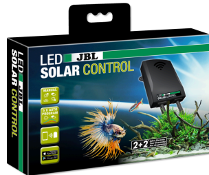
JBL LED SOLAR CONTROL Kontrollgerät für JBL LED SOLAR Leuchten