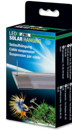
JBL LED SOLAR Hanging Seilaufhängung für JBL LED SOLAR Leuchten