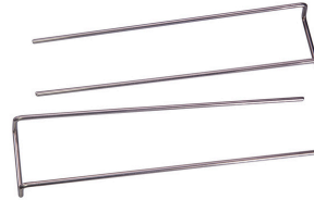
JBL LED SOLAR Haltebügel Set