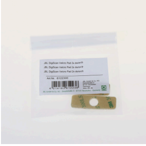
JBL DigiScan cırt-cırt, 2x