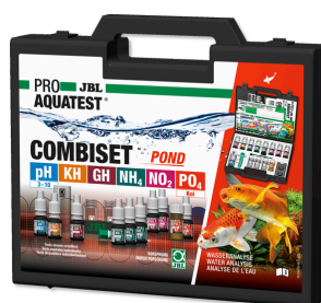
JBL PROAQUATEST COMBISET POND Coffret d'analyses d'eau en bassins