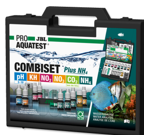
JBL PROAQUATEST COMBISET Plus NH4 Coffret avec les principaux tests d'eau + test NH4