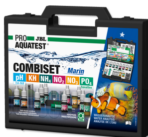
JBL PROAQUATEST COMBISET Marin Testkoffer für Wasseranalysen in Meerwasseraquarien