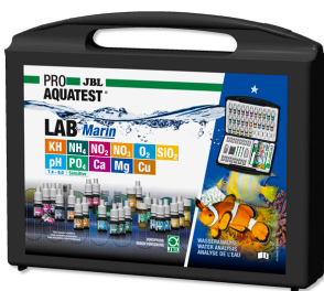
JBL PROAQUATEST LAB Marin Professioneller Testkoffer zur Meerwasser-Analyse