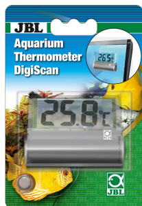
JBL termometro per acquari DigiScan Termometro digitale adesivo per i vetri dell'acquario