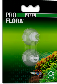
JBL klipsli vantuz 6 mm

Yakl. 6 mm çap. nesnelere için klipsli saydam vantuzlar