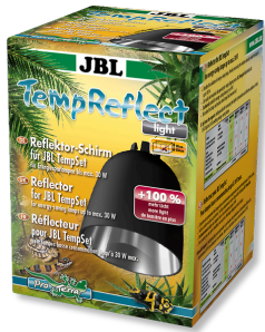
JBL TempReflect light Réflecteur pour lampes basse consommation