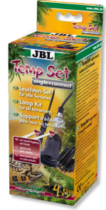
JBL TempSet angle+ connect Kit d'installation pour spot de terrarium